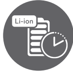
1h20 charge | 1h45 use