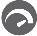
5750 high rpm