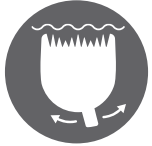
BLENDING BLADE 0,5 – 2 mm